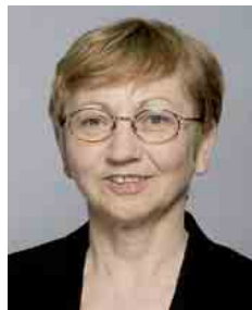
Inge Höger, MdB Donnerstag, 20. November 2008