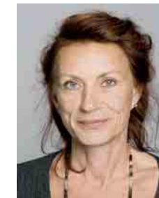
Ulla Jelpke, MdB Freitag, 21. November 2008