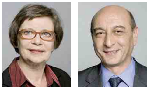
Ulla Lötzer, MdB; Hüseyin Aydin, MdB Donnerstag, 20. November 2008