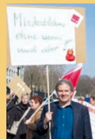
Andrej Hunko ist Mitglied des Deutschen Bundestags für die Fraktion DIE LINKE. Dort arbeitet er im Ausschuss für Angelegenheiten der EU.

Beschäftigten die Verlierer in der EU sind. Europa wird sozial sein – oder es wird nicht sein.